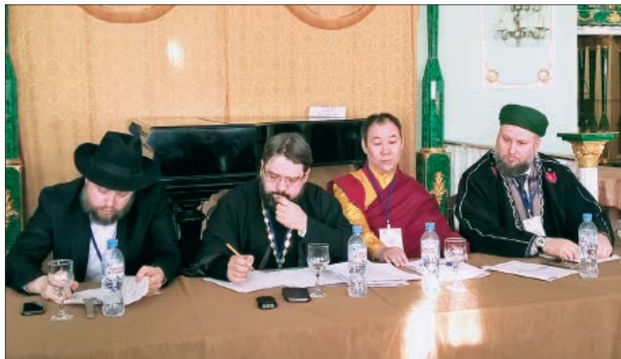
Заседание секции «Межрелигиозное взаимодействие и сотрудничество в развитии преподавания религиозных культур в общеобразовательной школе».

Конференция собрала более 350 участников из 77 регионов России. Среди выступавших были первый заместитель министра образования и науки РФ Ва-