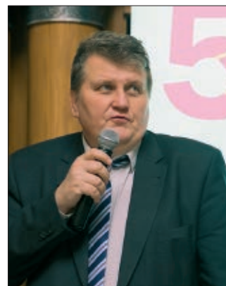
Заместитель руководителя Департамента национальной политики и межрегиональных связей Москвы Константин Блаженков