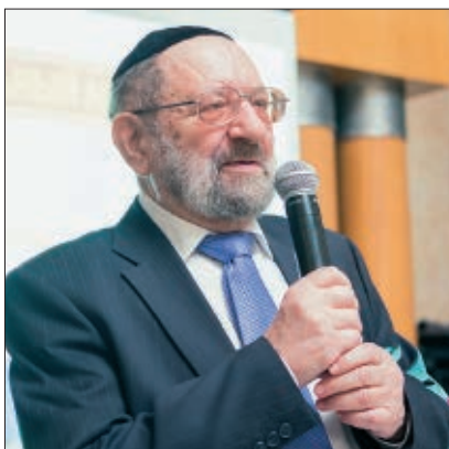
Главный раввин России (КЕРООР) Адольф Шавевич