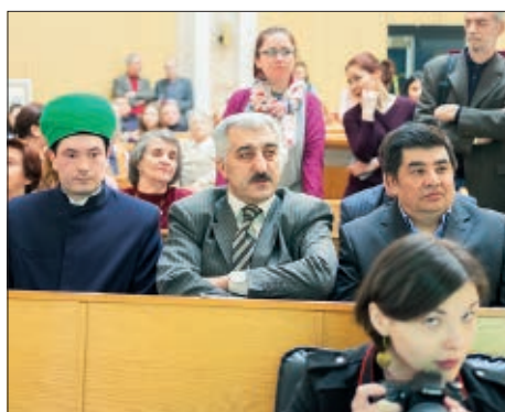
Почетные гости церемонии