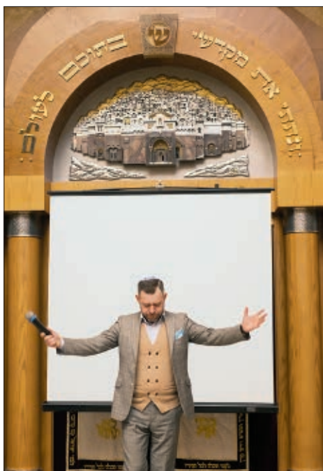
Заслуженный артист России Евгений Валевич