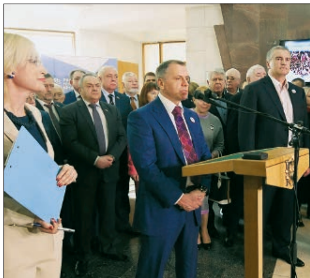
Выступает председатель Государственного совета Республики Крым Владимир Константинов

В церемонии открытия участвовали глава Республики Крым Сергей Аксенов, председатель Государственного совета республики Владимир Константинов, член Совета Федерации РФ Сергей Цеков, депутат Государственной думы РФ Андрей Козенко и другие почетные гости.